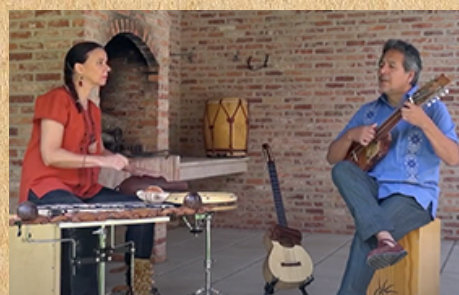
El ultimo hielero + Caxilimba pra Mico