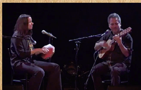
La Guanabana (Concert « Le monde est un village à 20 ans »)